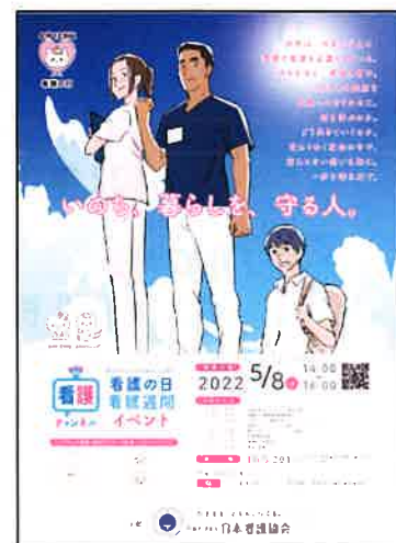
「看護の日」イベント 告知用ポスター・チラシ