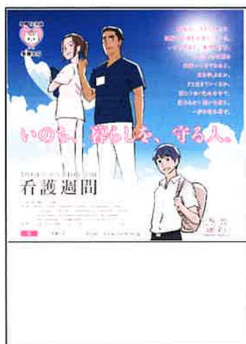
「看護の日」 ポスター （刷り込み枠あり）

※デザイン・コピー【最終版】の準備ができ次第、法人会員ネットに画像を掲載させていただきます。