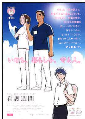
「看護の日」 ポスター・チラシ （刷り込み枠なし）