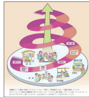
「看護職のためのACP支援マニュアル」より